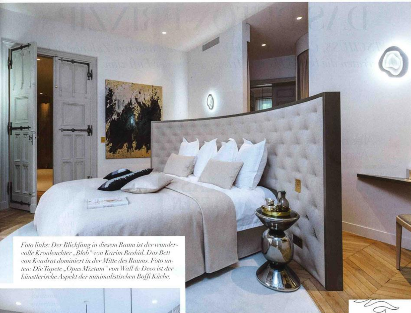
Foto links: Der Blickfang in diesem Raum ist der wunder-volle Kronleuchter „Blob“ von Karim Rashid. Das Bett von Kvadrat dominiert in der Mitte des Raums. Foto un-ten: Die Tapete „Opus Mixtum“ von Wall & Deco ist der künstlerische Aspekt der minimalistischen Boffi Küche.