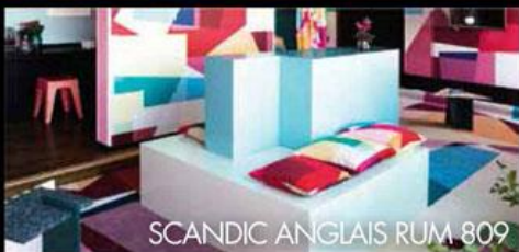
SCANDIC ANGLAIS RUM 809